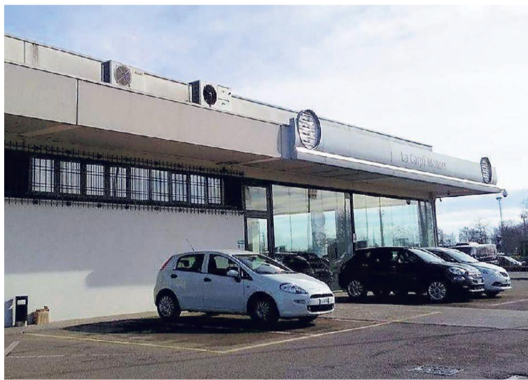
La concessionaria La Carpi e l'impronta delle insegne Fiat rimosse nei giorni scorsi da tutti i punti dell'edificio