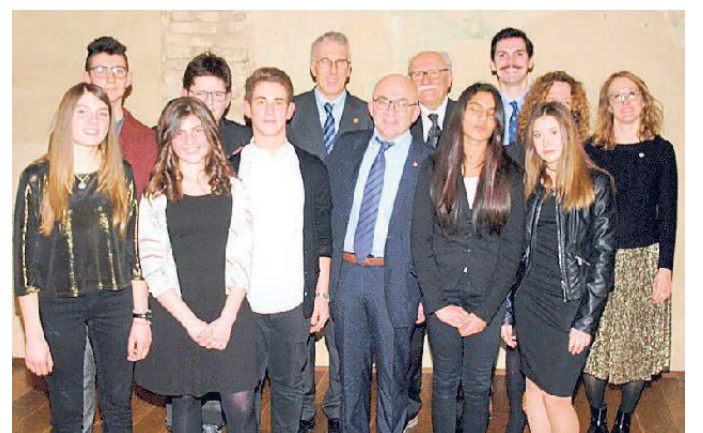
I ragazzi che hanno ricevuto i premi "La faretra" dai Lions